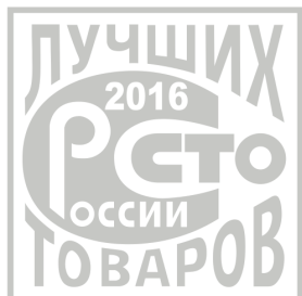
«100 лучших товаров России»